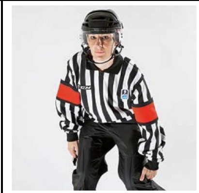
Clipping - CLIPP

De scheidsrechter beweegt met open handpalm naar de zijkant van het hoofd.