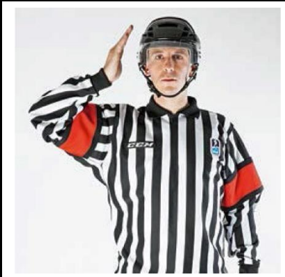
Checking to the Head - CHECK-H

De scheidsrechter maakt met open handpalmen een beweging naar voren.