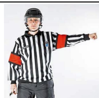
Roughing - ROUGH

De scheidsrechter beweegt beide vuisten naar elkaar toe voor de borst.