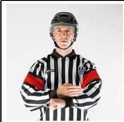
Slashing - SLASH

De scheidsrechter maakt met de zijkant van de open hand een slaande beweging op de pols van de andere arm.