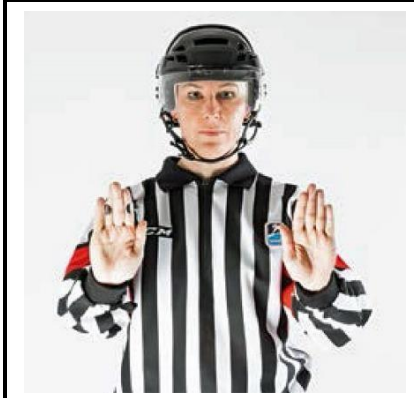
Checking from Behind - CHECK-B

De scheidsrechter draait de armen met samengebalde vuisten voor de borst om elkaar heen.