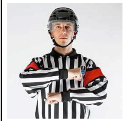
Charging - CHARG

De scheidsrechter beweegt voor de borst beide armen over elkaar heen. De ene hand is gestrekt, de andere vormt een vuist.