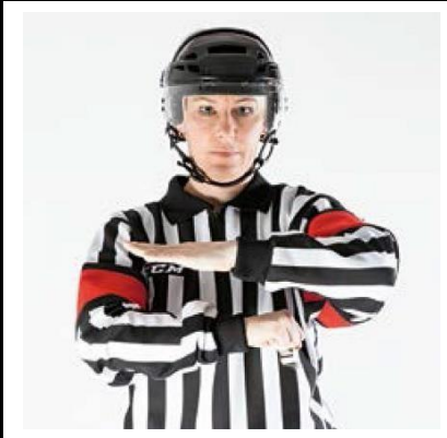
Butt Ending - BUTT

De scheidsrechter slaat voor de borst met gebalde vuist tegen de gestrekte handpalm van de andere hand.