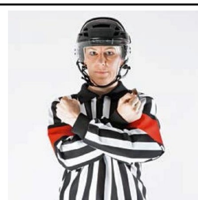
Interference - INTERF

De scheidsrechter plaatst de platte hand op de andere schouder.