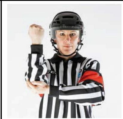
Elbowing - ELBOW

De scheidsrechter houdt de handen boven elkaar om vervolgens de rechterarm naar rechts te zwaaien. Let op! Alleen voor het buiten het speelveld schieten van de puck.