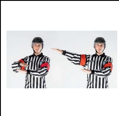
Delaying the Game - DELAY

De scheidsrechter houdt de handen met samengebalde vuisten op ongeveer een halve meter afstand van elkaar. Vervolgens wordt voor de borst een duwende beweging naar voren gemaakt.