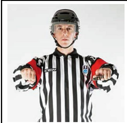
Cross-Checking - CROSS

De scheidsrechter slaat met de zijkant van de open hand in de knieholte.