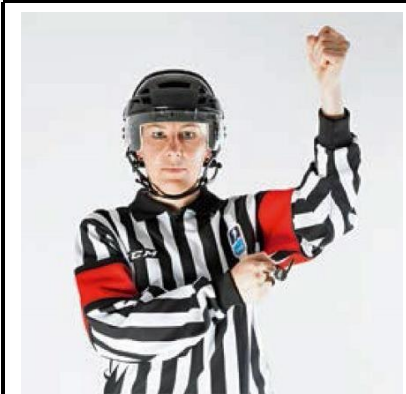
High Sticking - HI-ST

De scheidsrechter brengt samengebalde vuisten boven elkaar ter hoogte van het voorhoofd.