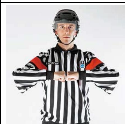
Late Hit - L-HIT

De scheidsrechter brengt een open handpalm naar de knie.