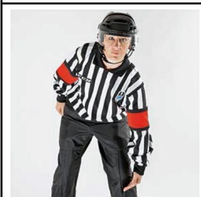
Tripping - TRIP

De scheidsrechter geeft met zes vingers (een open hand) het teken voor de borst.