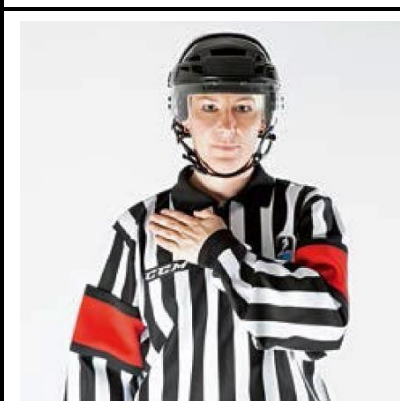
Illegal Hit - ILL-HIT

De scheidsrechter maakt een trekkende beweging met beide armen alsof een voorwerp richting de maagstreek wordt getrokken.