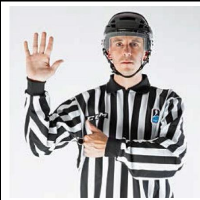
Too Many Players - TOO-M

De scheidsrechter maakt met beide armen een stekende beweging zijwaarts.