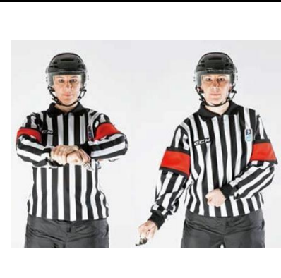
Holding the Stick - HOLD-S

De scheidsrechter houdt met de ene hand de pols van de andere arm vast.