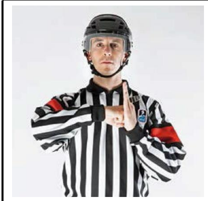
Boarding - BOARD

De scheidsrechter slaat voor de borst met gebalde vuist tegen de gestrekte handpalm van de andere hand.