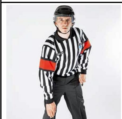
Kneeing - KNEE

De scheidsrechter houdt beide armen met gebalde vuisten kruislings voor de borst.