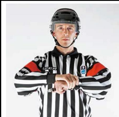
Holding - HOLD

De scheidsrechter brengt samengebalde vuisten boven elkaar ter hoogte van het voorhoofd.