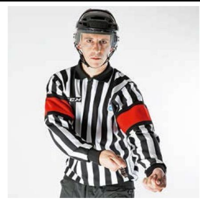
Spearing - SPEAR

De scheidsrechter maakt met de zijkant van de open hand een slaande beweging op de pols van de andere arm.